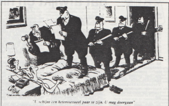
"U schijnt een heteroseksueel paar te zijn. U mag doorgaan"